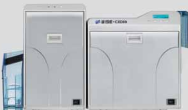
WISE-CL600 (Laminador) WISE-CXD80 (Impresora)